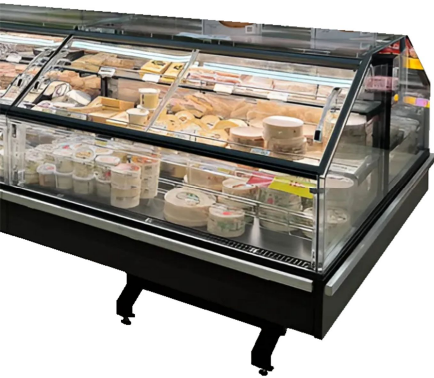
Gemini EN 120 T GD 1250

LÍNEA ENERGIA, CENTRADA EN EL RENDIMIENTO