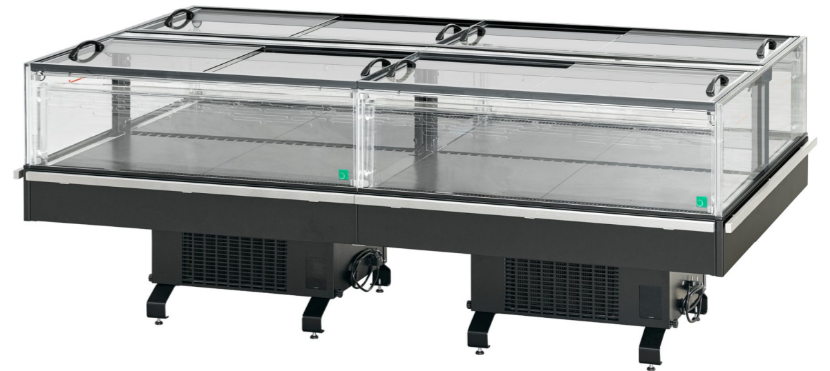
Gemini EN 120 Maxi GD 1250