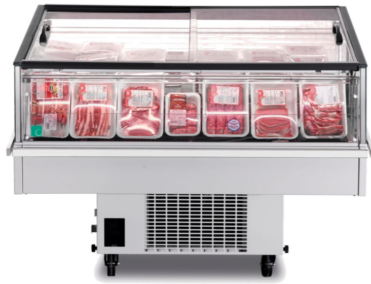
Giano EN 90 VD GD 1250

LÍNEA ENERGIA, CENTRADA EN EL RENDIMIENTO