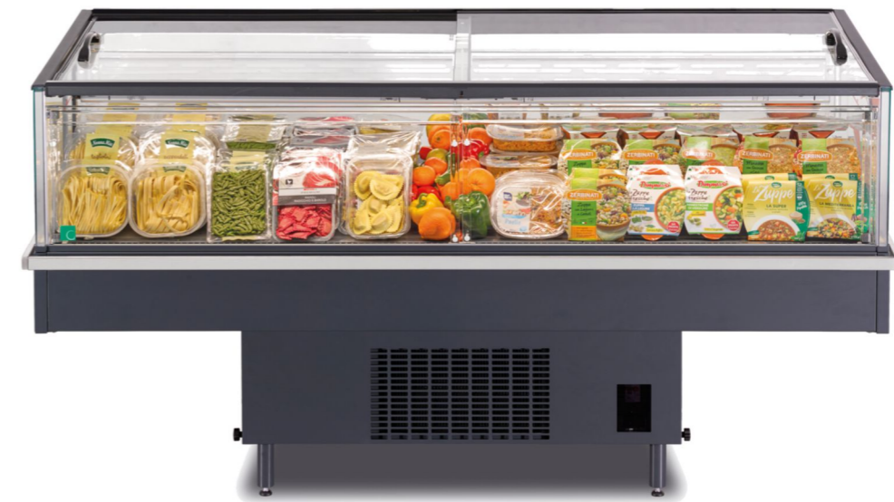
Giano EN 70 MAXI GD 1875