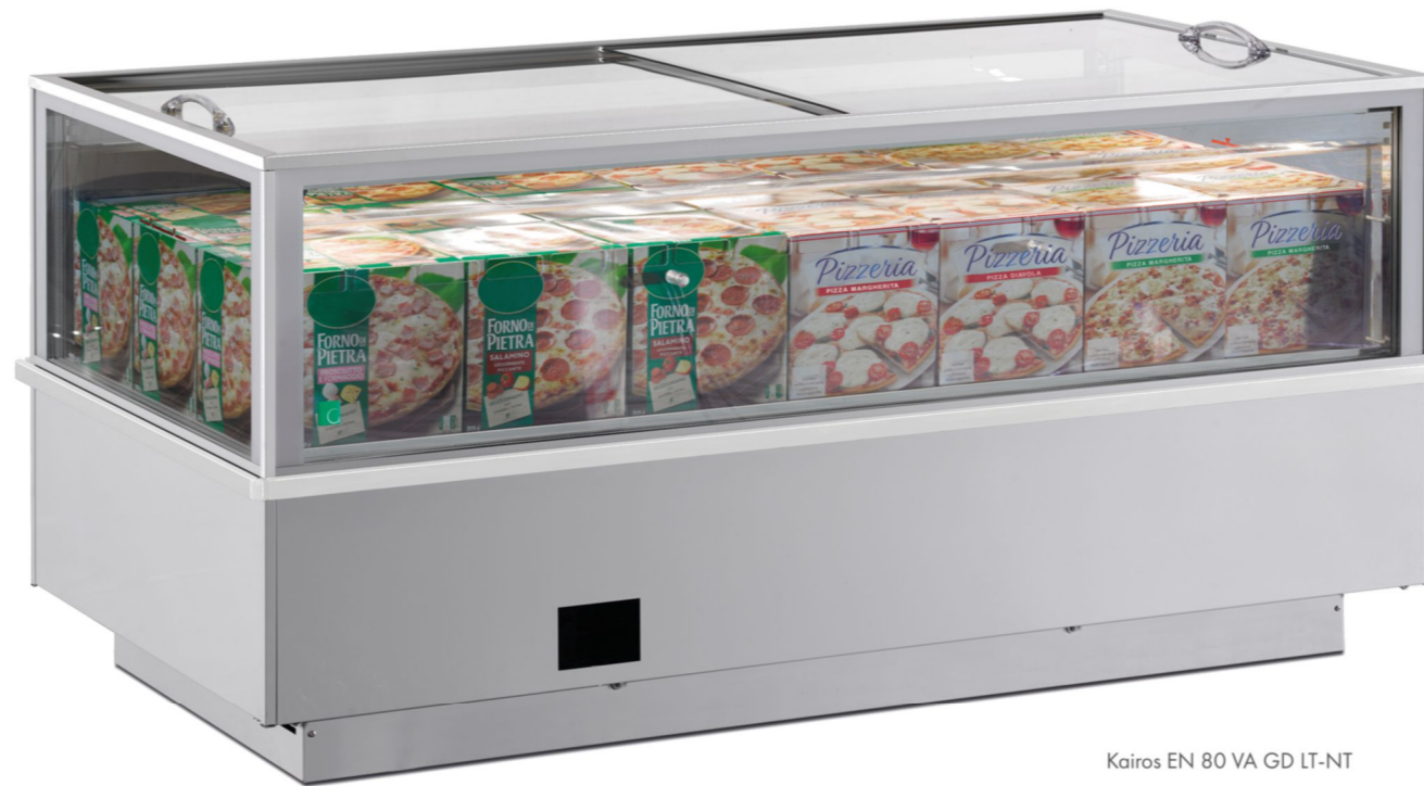
Kairos EN 80 VA GD LT-NT